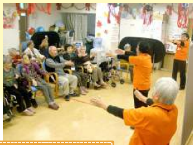
ボランティア訪問(歌体操)