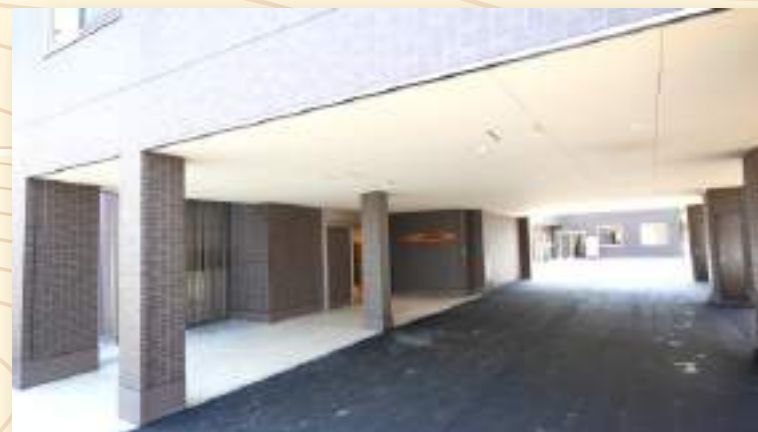
入口からの玄関への通路