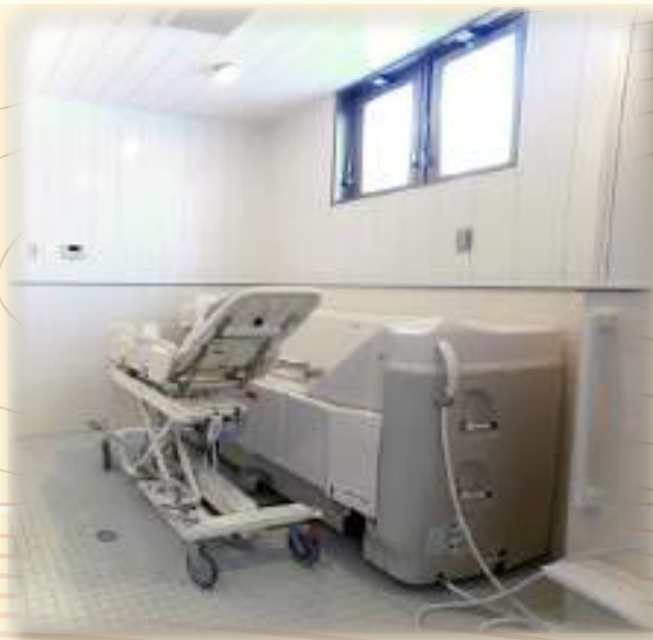
機械浴 (デイサービス)